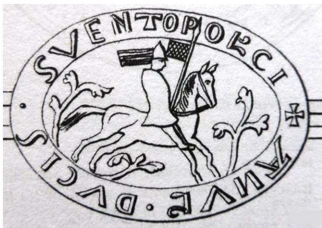
PIECZEŃ z 1236 r.

PO TRZECIE – tenże ŚWIĘTOPEŁEK w 1246 roku przekazał biskupowi MICHAŁOWI